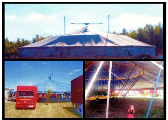
• Chapiteau 33 Diamètre 854m2 4 000 € H.T. Capacité 900 assis 1 700 debout