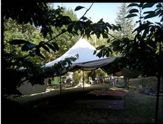
• Tente mauritanienne 5X5m 25m2 250 € H.T. Capacité 25 assis