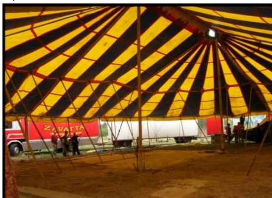
• Chapiteau 18X24 432m2 1 800 € H.T. Capacité 400 assis 800 debout