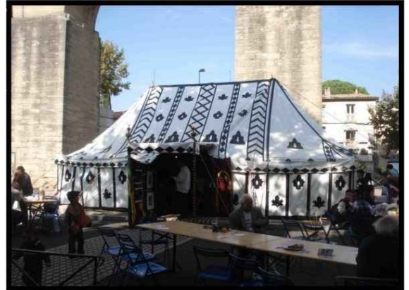
• Tente caïdale 5X10m 50m2 600 € H.T. Capacité 40 assis 80 debout