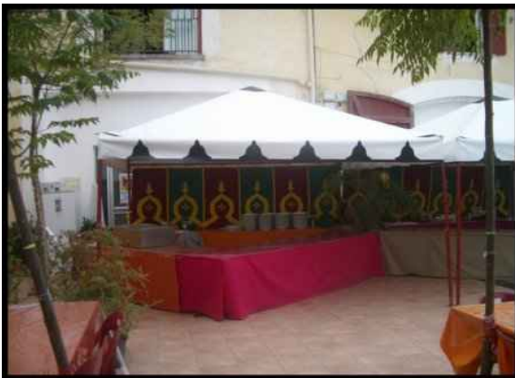
• Tonnelle caïdale 3X3m 9m2 200 € H.T. Capacité 9 assis 20 debout • Tonnelle caïdale 4X4m 12m2 300 € H.T. Capacité 16 assis 30 debout