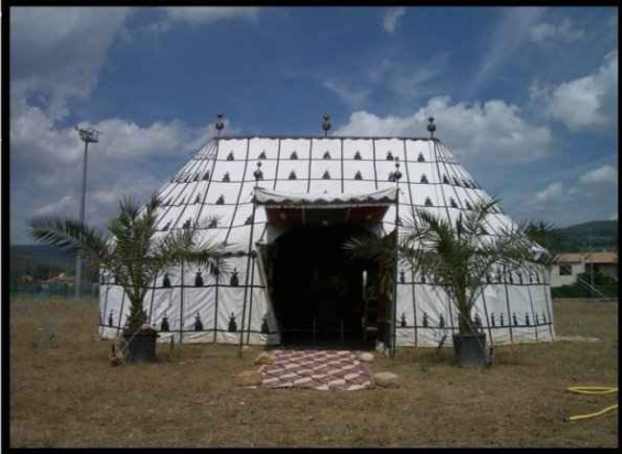
• Tente caïdale 4X8m 32m2 450 € H.T. Capacité 32 assis 50 debout