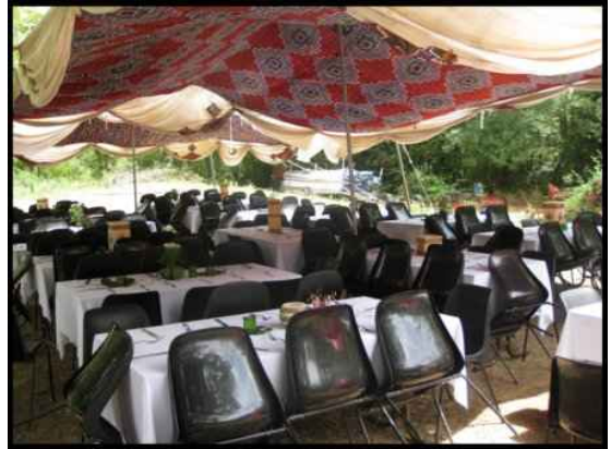
• Tente 6X6m 36m2 350 € H.T. Capacité 50 assis