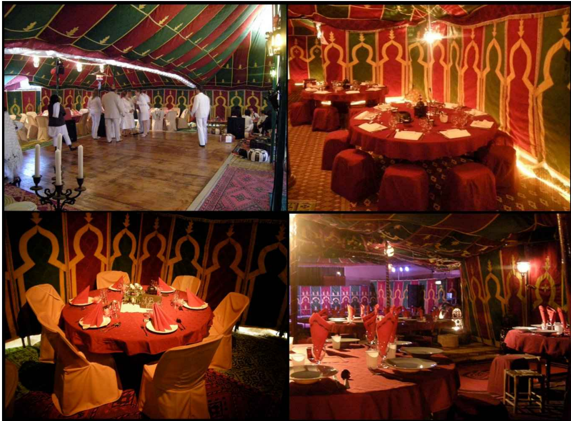
Mise en situation de quelques uns de nos équipements