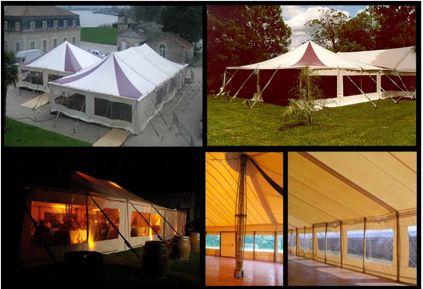
Détails photographiques chapiteau mâture bambou