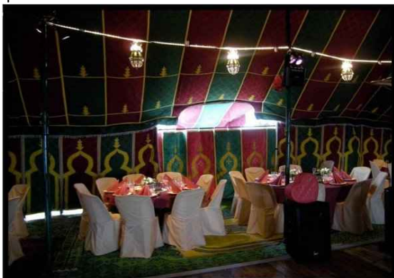
• Intérieur caïdal disponible dans toutes nos tentes