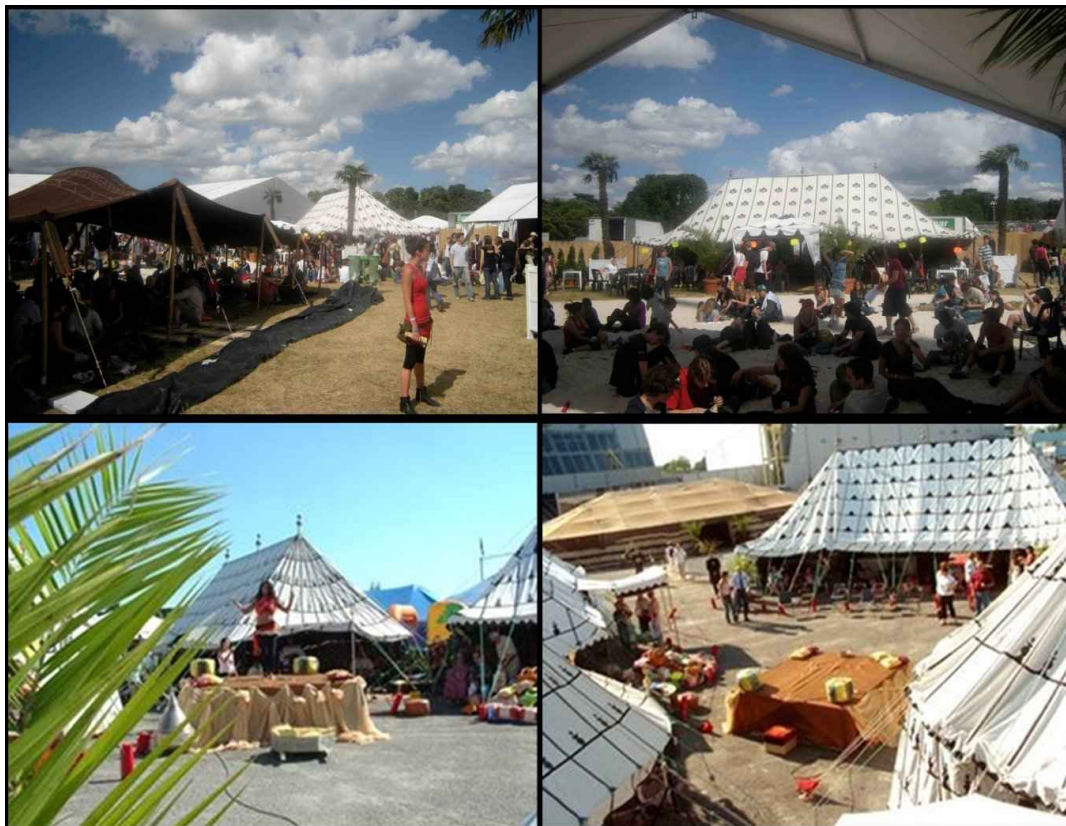
« La Palmeraie » Solidays 2008 et souk foire de Saumur 2006

Cette formule est proposée en tarification sur mesure.