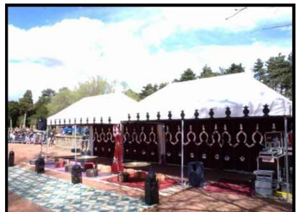
• Tonnelle caïdale argent 3X6m 18m2 300 € H.T. NOUVEAUTE 2010 !