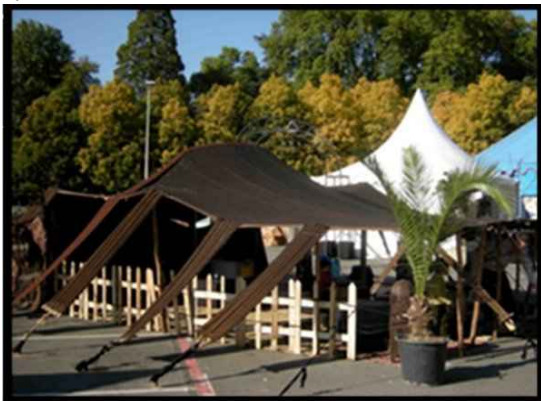
• Tente berbère du désert 6X10m 60m2 500 € H.T. Capacité 60 assis