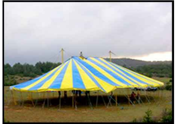
• Chapiteau 18 Diamètre 300m2 1 500 € H.T. Capacité 280 assis 500 debout