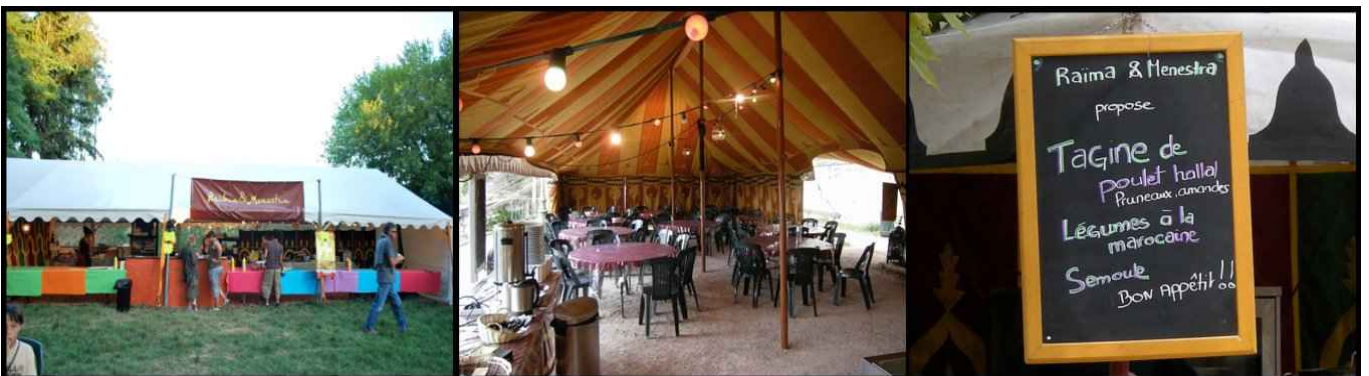
Stands publics Solidays 2008 et Wonegain Fever Festival 2009

Nous disposons également d'un équipement complet de stand de vente au public, adaptable à tout lieu et tout type d'évènement, conçu pour proposer tout type de prestation de restauration : de la formule snack au repas sophistiqué, de la cuisine des 4 coins du monde aux spécialités régionales françaises.