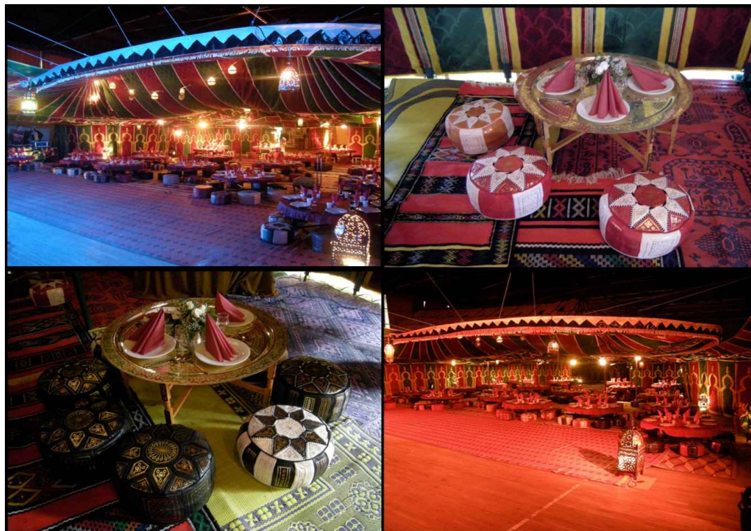
Mise en décor de salle des fêtes et dressage de tables de réception sous tente

Pour une soirée à thème complète, notre service traiteur peut composer un buffet assorti au décor choisi.