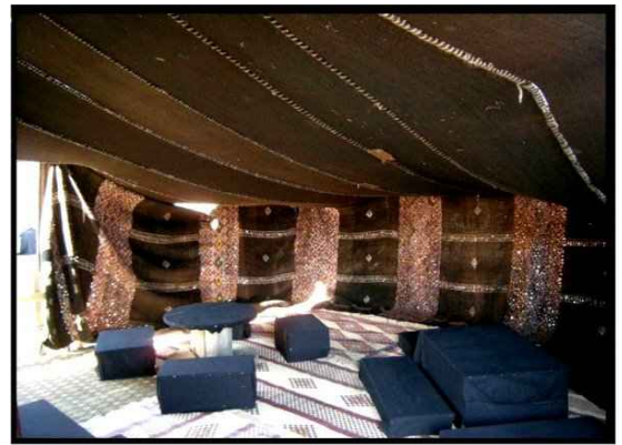
• Intérieur mosaïque de miroirs