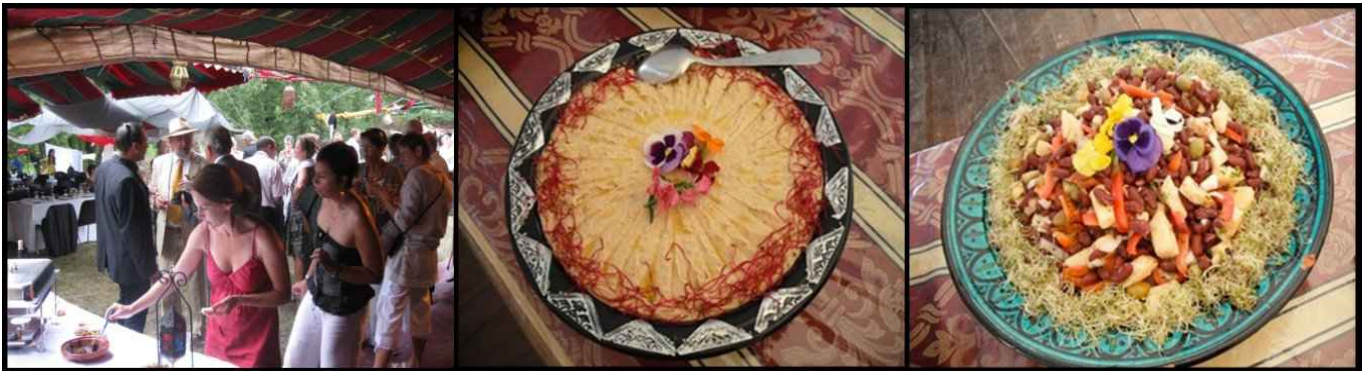
Service traiteur lors d'un mariage et exemples d'entrées proposées pour le Catering du Festival de Thau 2009

Tarifs : de 10 € à 20 € H.T. par personne selon le nombre de personnes, la durée de la prestation et la composition des plats - De 50 à 1 000 repas par service.