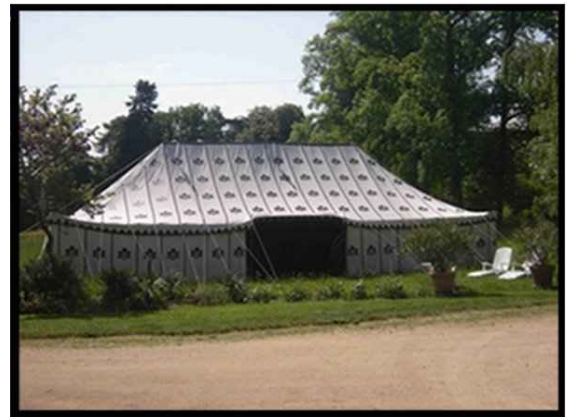
• Tente caïdale 7X14m 98m2 1 000 € H.T. Capacité 80 assis 150 debout