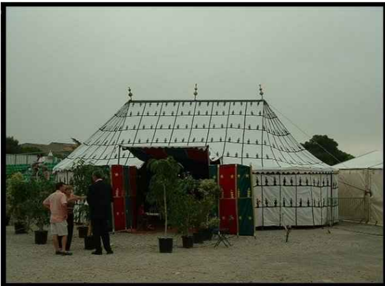
• Tente caïdale 6X12m 72m2 800 € H.T. Capacité 60 assis 100 debout