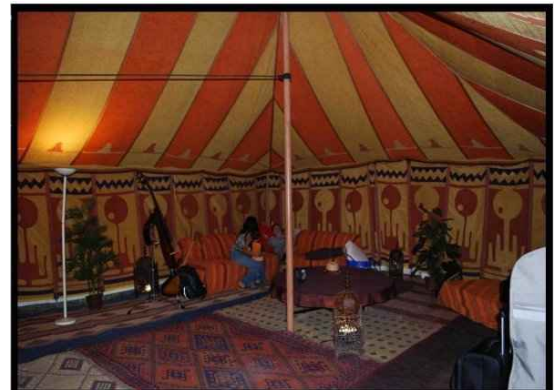
• Intérieur ocre disponible en 6X12 et 7X14