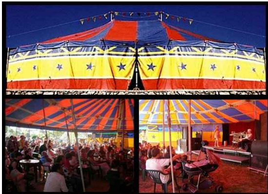
• Chapiteau 14X17m 238m2 1 400 € H.T. Capacité 200 assis 250 debout